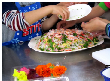
酢飯には、高級食材「はばのり」も入っています。菜花、今が旬でとっても甘い「スナップエンドウ」も