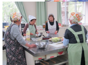
下準備をする、地元 民宿組合の女将さん達