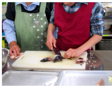
女将さん達に教えてもらいながら三枚おろしに初挑戦!