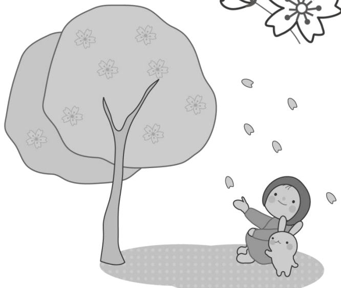
三芳の山や林道には、たくさんの桜が植えられています。