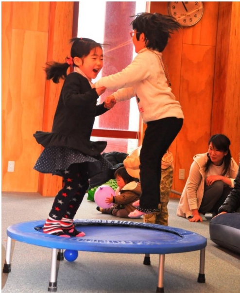
トランポリンで遊ぶ子どもたち

この活動は、富浦地域づくり協議会「さざなみ」のメンバーによるものです。多くの方々の参加をお待ちしています。