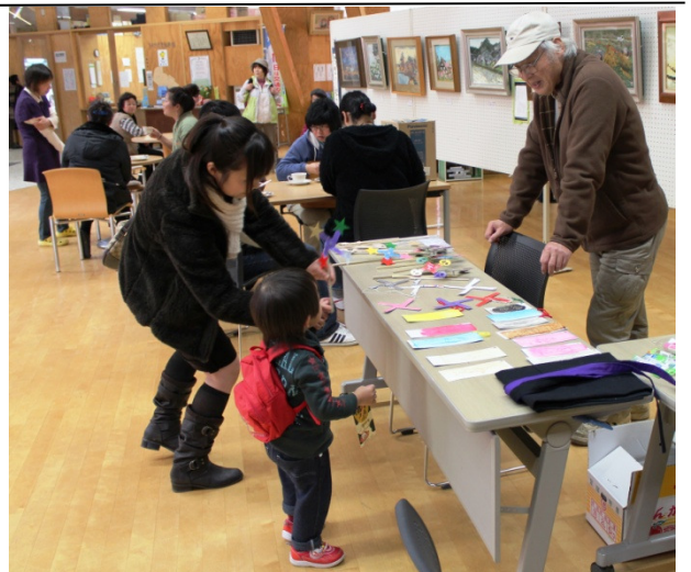
びわ茶房での工作教室