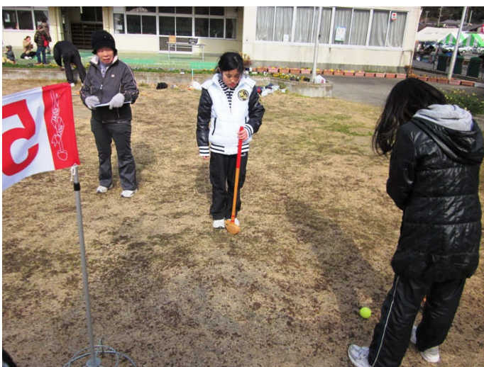
富浦幼稚園では、軽スポーツグループによるグランドゴルフ教室が開催され、ホールインワンショーなど、豪華賞品がもらえる催しがありました