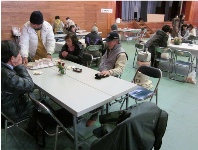
富浦体育館内の会場にびわ茶房が出店し、訪れた方に憩いの場所を提供していました