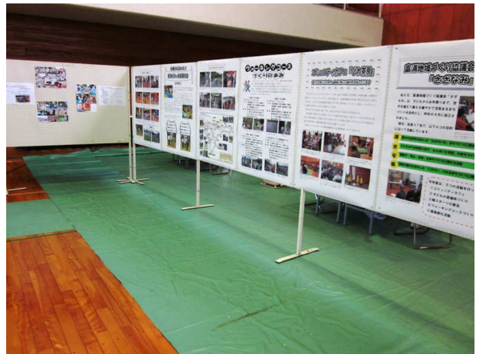
各活動のパネル展示を行いました