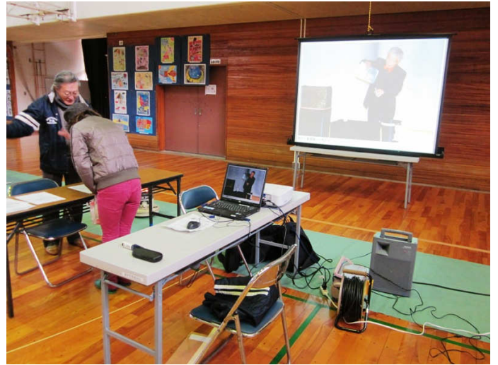
子ども居場所づくりグループでは、これまでの活動をスライドショーで発表しました