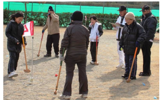
小学生も富浦さざなみフェスティバルでグラウンド・ゴルフを体験

私は、1月29日、グラウンド・ゴルフの練習に初めて参加しました。とても楽しかったです。 私は、グラウンド・ゴルフのルールも打ち方も知りませんでした。しかし、指導員のおじさんたちが、わかりやすく教えてくれたので、すぐに覚え、楽しくボールを打てました。 また、私と友だちは、とてもがんばり、ホールインワンを出し、ハンド・ソープを賞品としてもらうことができました。