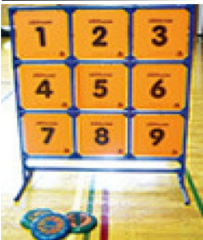
ストラックアウト(用具)