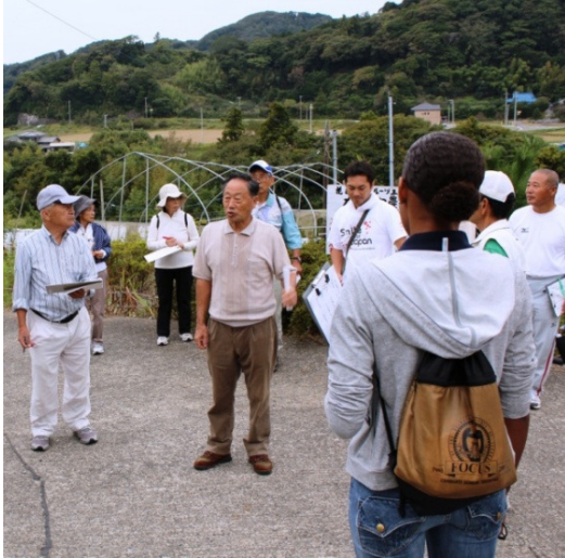
名所の由来を語るガイドさん