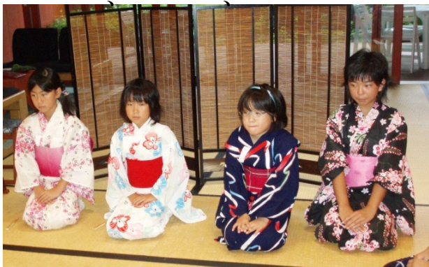
地域の人達をもてなす子ども達

お茶で地域の人達との交流 毎週木曜日、13時30分から元氣倶楽部で、多くの人達が、お茶を通じた交流を楽しんでいます。 特に8月22日は、「四季の茶会」が開かれ、子ども達が和服で地域の人達をもてなしていました。 富浦の子ども達にも日本文化の一つである茶道が、受け継がれているようです。