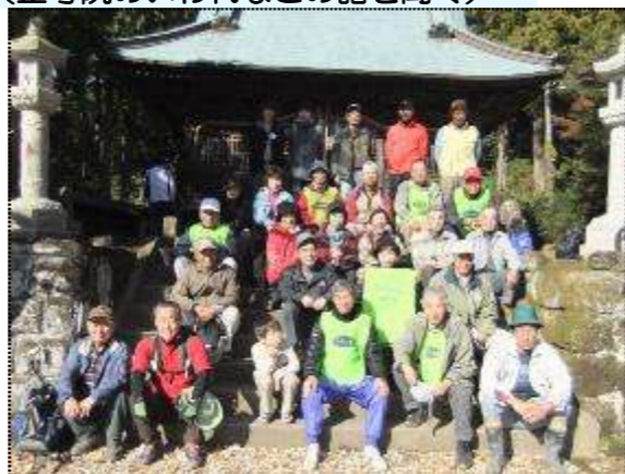
(昼食後、参加者で記念写真)