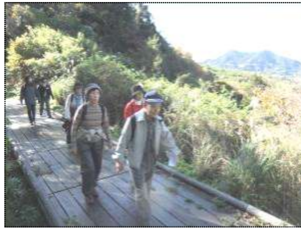
(遠く富山を後に見て、伊予ヶ岳へ向かう)