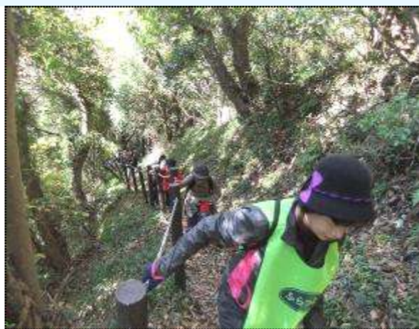
(登りが延々と続き、黙々と展望台を目指す)

当日の朝はこの冬の冷え込みでしたが、風もなく絶好のハイキング日和になり、伊予ヶ岳登山では途中でツアーの人たちと擦り合いながら、展望台を目指しました。参加者は途中棄権する人もなく、全員完歩して登山に歴史探訪に、満足するハイキングになったと思います。