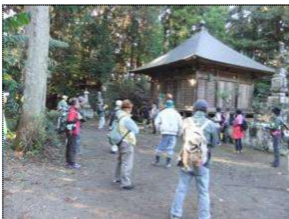
(正寿院のいわれなどの話を聞く)