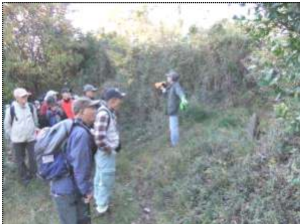
(途中で馬頭観音の説明を受ける)

当日の朝はこの冬の冷え込みでしたが、風もなく絶好のハイキング日和になり、伊予ヶ岳登山では途中でツアーの人たちと擦り合いながら、展望台を目指しました。参加者は途中棄権する人もなく、全員完歩して登山に歴史探訪に、満足するハイキングになったと思います。