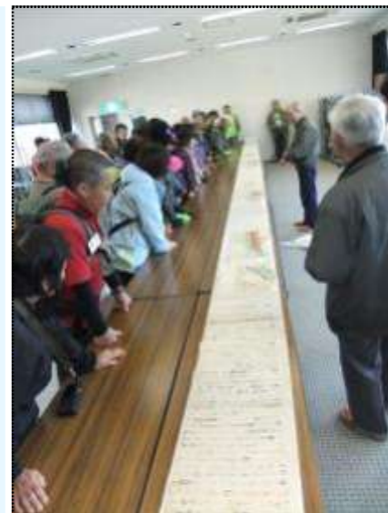
(ハイキングの目玉、平久里天神縁起絵巻の説明を聞く参加者)

行程は、吉井農村公園を発着点に、川上駅跡・伊予ヶ岳展望台・天神社・正寿院を巡る約10キロのコースで、途中民俗資料館やコミュニティセンターに寄り、富山の歴史の見学や県文化財指定の紙本著色天神縁起絵巻を鑑賞して、総勢36人が平群の自然と貴重な文化財を満喫したハイキングになりました。