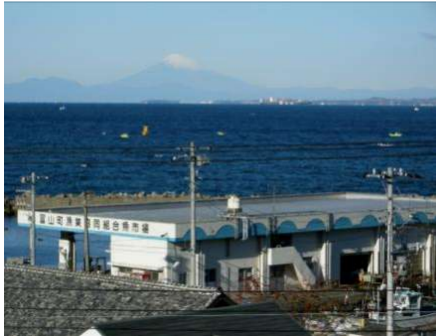
高崎の国道127号線から富士山を望む