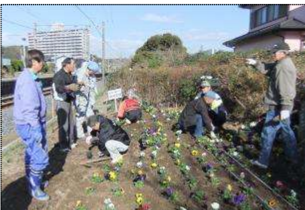
(配色を考えながら5色のパンジーを植えてゆく、観光協会岩井支部といわい案内人の会・ふらっとのメンバー 写真上下)

当日は28人が参加して、管理機やつるはし・スコップで硬い花壇の土を掘り起こして、約30センチおきに白・黄・紫・青・ピンクの五色の