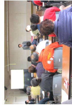
ノーマライゼーションとは、障害者と健常者とは、お互いが特別に区別されることなく、社会生活と共にするのが正常なことであり、本来の望ましい姿であるとする考えです。(出典：ウィキペディア)

固有の風土を作り出している説明し、「風の人」は、興味を引く何かがあれば集まって来るので、「地の人」が千倉の宝さがしをして、地域資源を生かした居住者主体のまちづくりを行っていくことの必要性と、そのヒントとして、「町の活性化を目指す6つの生活(空間)デザイン」まちのたから」を教えて頂きました。