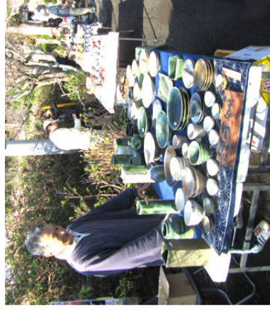
陶器市は、作家の熱意に触れ、掘り出し物との“一期一会”の出会いが楽しめる一時的です。

高家神社は、日本で唯一、料理の祖神をまつる神社ですが、高家学ぼう会が、庖丁式の日「食にまつわるイベントをひらきたい」として十一月二三日(水)に南房総の六楽元による陶器市を開催しました。