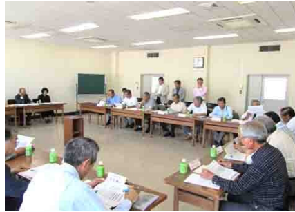
千倉区長会で協議会設立の趣旨と経緯を説明しました