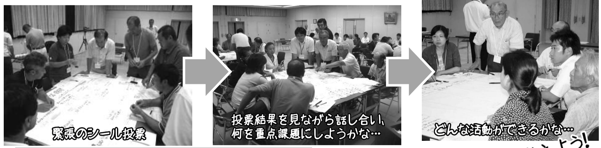
緊張のシール投票