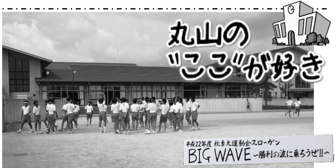
平成22年度 秋季大運動会スローガン BIG WAVE ~勝利の波に乗ろうぜ!!~

9月5日(日)は丸山中学校の秋季大運動会でした。国道410号線を車で走っていると、ひと際目立つクリーム色の建物が丸山中学校です。