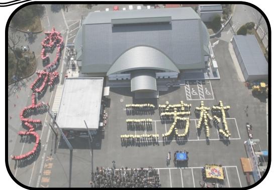
「三芳村から南房総市に変わり丸4年」

みなさんは今の三芳をどう思っていますか？ 「こうすればもっと良くなるのになあ」 「三芳のために何かしてみたいなあ」 と 思っている方と いろいろな話をしながら、 もともともっと住みやすいところにしていく。 それが「みよし手づくりプロジェクト」です。