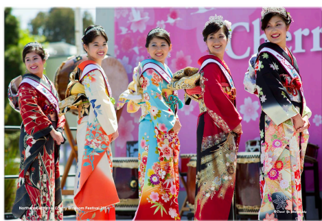
北カリフォルニア桜祭り(2014)